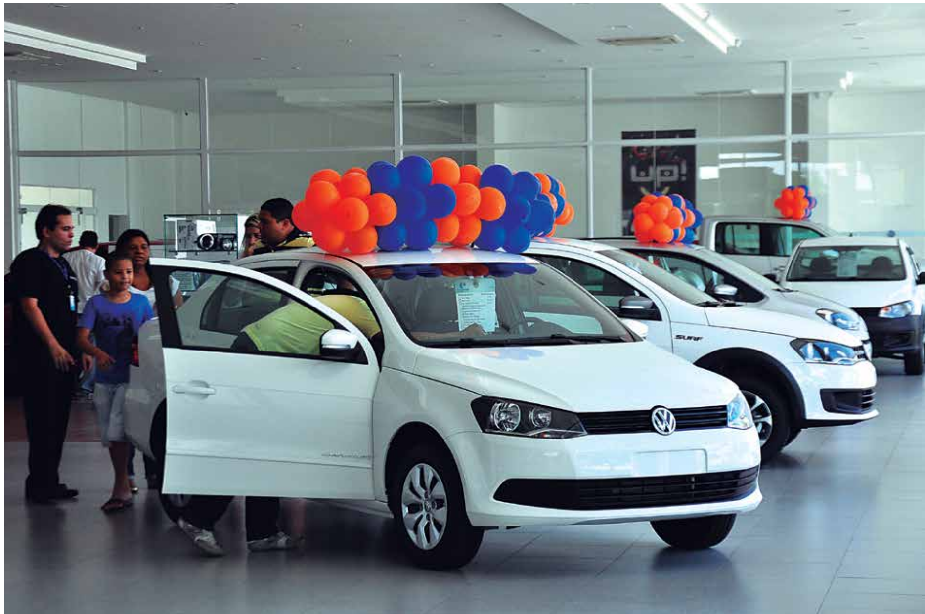
Copa do Mundo e eleições prejudicaram as vendas de carros zero quilômetro nas concessionárias, provocando uma queda de 9,5% este ano em relação a 2013

Aumento do preço dos veículos 1.0 deve ficar em torno de R$ 1.500