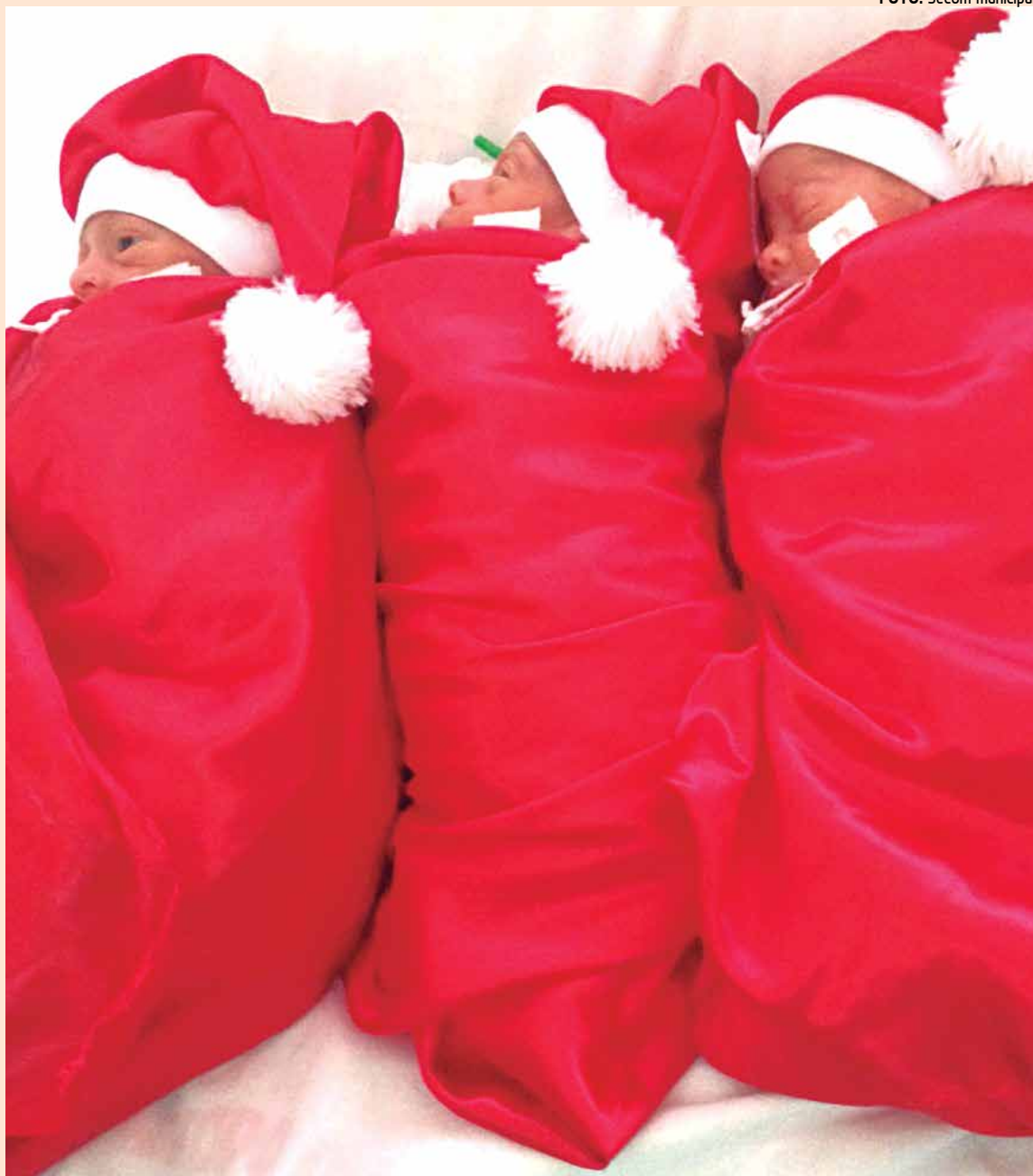
Bebês proporcionam clima natalino para mães; roupas foram doadas pelos funcionários do ICV

No Instituto Cândida Vargas (ICV), o método foi implantado há 15 anos, sendo a primeira maternidade na Paraíba a aderir à assistência humanizada para as mães dos bebês. Em maio deste ano, o Ministério da Saúde emitiu uma certificação atestando o ICV como Centro de