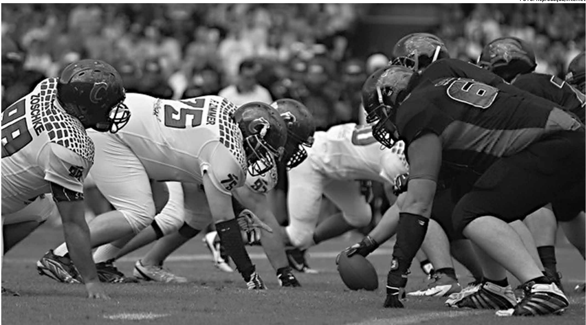
Início do jogo entre o Coritiba e o Espectros realizado domingo passado no Estádio Couto Pereira com vitória dos paranaenses. Os paraibanos foram vice pelo segundo ano

O resultado deixou o grupo paraibano bastante abatido já que tiveram chances de despachar o adversário durante a partida ao estabelecer uma boa diferença e pelo visto o lado emocional pesou bastante para que o Coritiba empatasse e tomasse conta da partida até o apito final. Agora, a equipe paraibana entra de férias e somente em janeiro retorna aos trabalhos para a temporada de 2015.