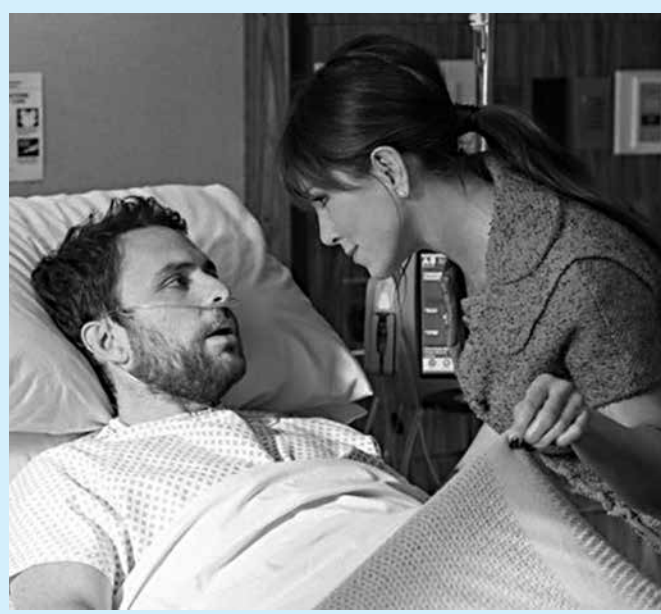
Comédia tem plano ilegal de trio para ganhar dinheiro

Um trabalho que comece desde os primeiros anos de escola e ações que realmente deem resultado nas áreas social e de segurança teriam um poder eficaz em fazer com que mais pessoas entendam que os direitos humanos devem ser defendidos e que não precisamos do "olho por olho, dente por dente" para fazer prevalecer a paz social.