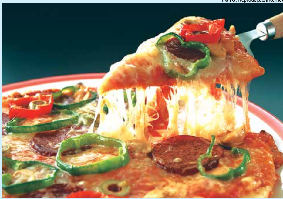
O sanduíche e a pizza estão na lista dos pratos mais consumidos

De acordo com a Pesquisa Nacional de Saúde com o público feminino, as mulheres têm a alimentação um pouco mais saudável: 28% das entrevistadas admitem que comem