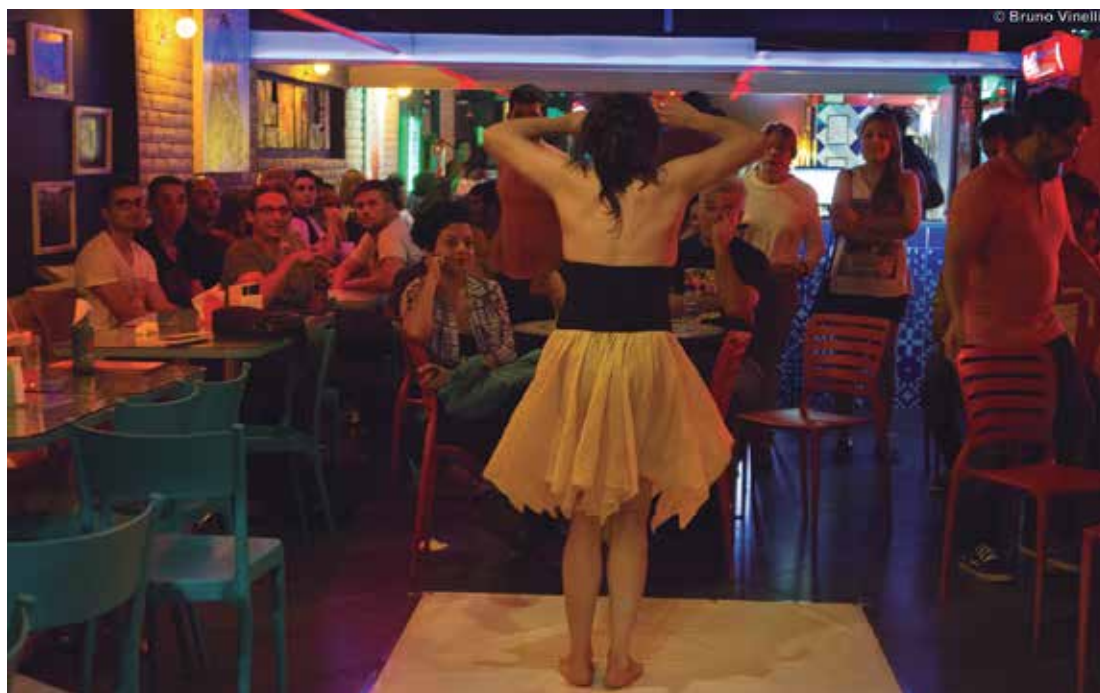
Cenas dos diversos eventos que fazem uma mescla entre poesia encenada, teatro e literatura, ocorridos ao longo de 2014, com diversas homenagens e participações especiais