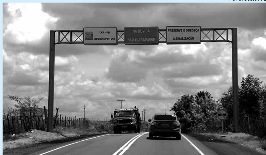
Iniciativa beneficia mais de 37 mil pessoas, além dos motoristas e caminhoneiros

O governador Ricardo Coutinho entregou, na manhã de ontem, a restauração da Rodovia PB-006, interligando os Municípios de Itabaiana e Juripiranga. Essa é mais uma obra do Programa Caminhos da Paraíba, que recebeu investimentos superiores a R$ 4,7 milhões e vai beneficiar mais de 37 mil pessoas, além dos motoristas e caminhoneiros que precisam viajar para Recife.