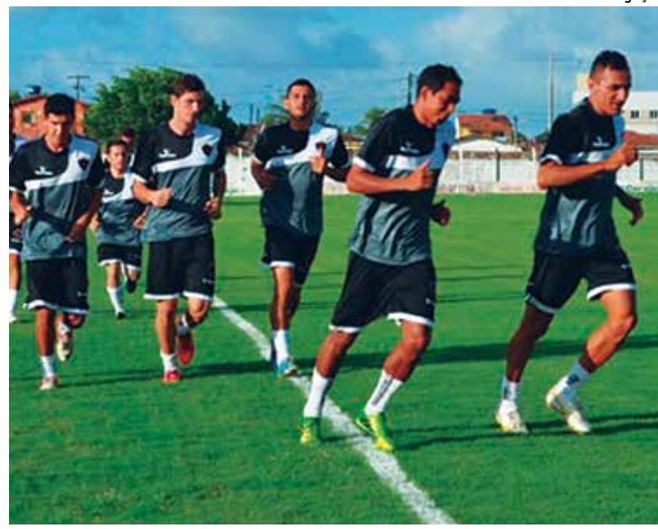
Enquanto a temporada 2015 não chega, o Botafogo segue treinando