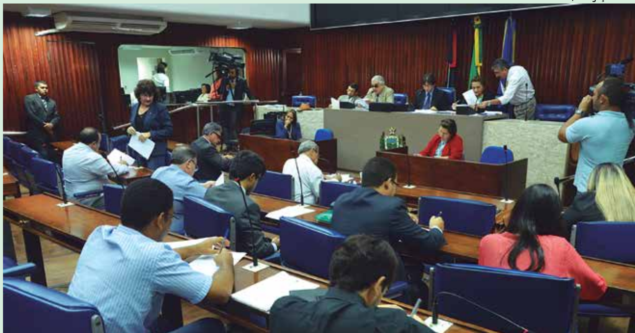
Entre os projetos que serão analisados hoje está o da disponibilidade de sinal wi-fi em ônibus intermunicipais