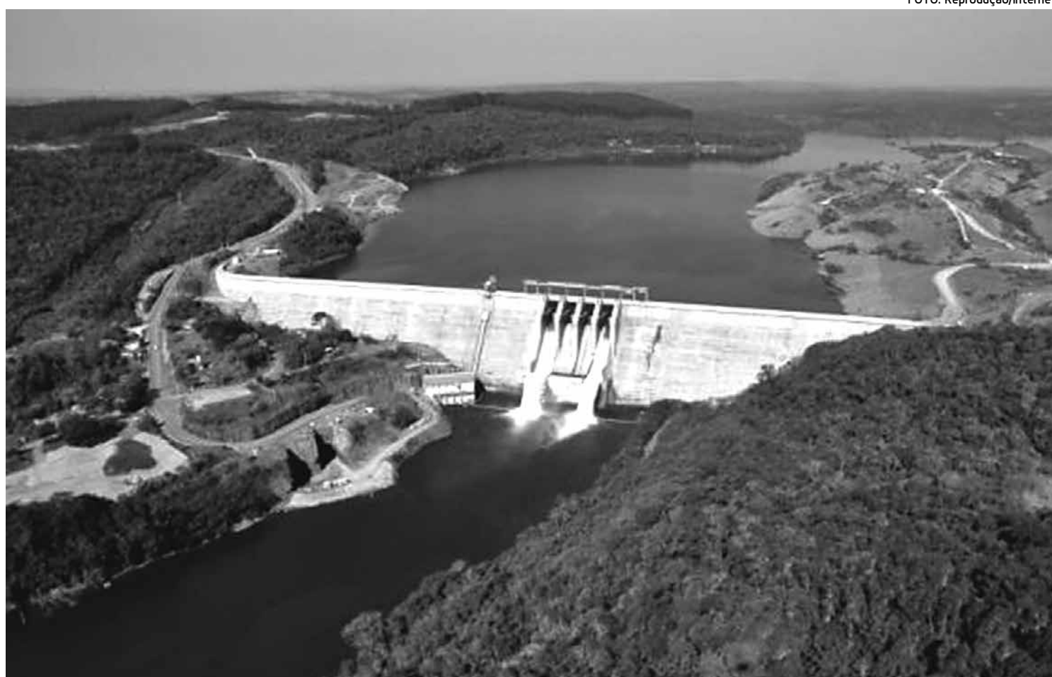
Do total de usinas pesquisadas, oito estavam em operação – Balbina, Tucuruí, Itaipu, Serra da Mesa, Xingó, Três Marias, Funil e Segredo

Do total de usinas pesquisadas, oito estavam em operação – Balbina, Tucuruí, Itaipu, Serra da Mesa, Xingó, Três Marias, Funil e Segredo – e três em fase de construção – Santo Antônio, Belo Monte e Batalha. Foram cole-