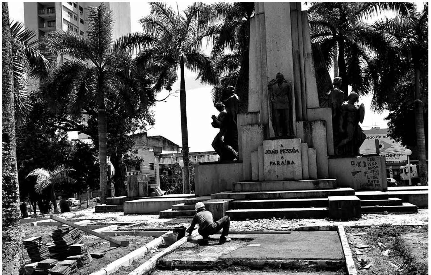
A reforma da área inclui instalação de novos bancos, reparação de postes, luminárias e restauração do monumento central

Antes de receber o nome do presidente paraibano assassinado, chamouse: Largo da Igreja do Colégio, Pátio do Palácio, Largo do Comendador Felizardo, Praça Felizardo Toscano e Jardim Público, que começou a ser construído em 1879, foi concluído em 1881